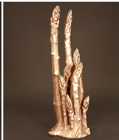
Familie Asperges / Asparagus Family