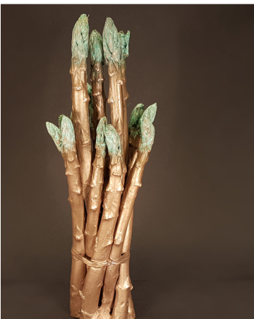
Vers groen / Fresh Green

Sinds de laatste nieuwsbrief, waarin ik onder andere een expositie in galerie Kunstruim aan de Nieuwendijk aankondigde, heb ik enkele beeldjes gemaakt met als thema: asperges. De meeste hiervan zijn ondertussen verkocht, maar tijdens Open Ateliers Amsterdam Noord zijn er nog 3 beschikbaar.