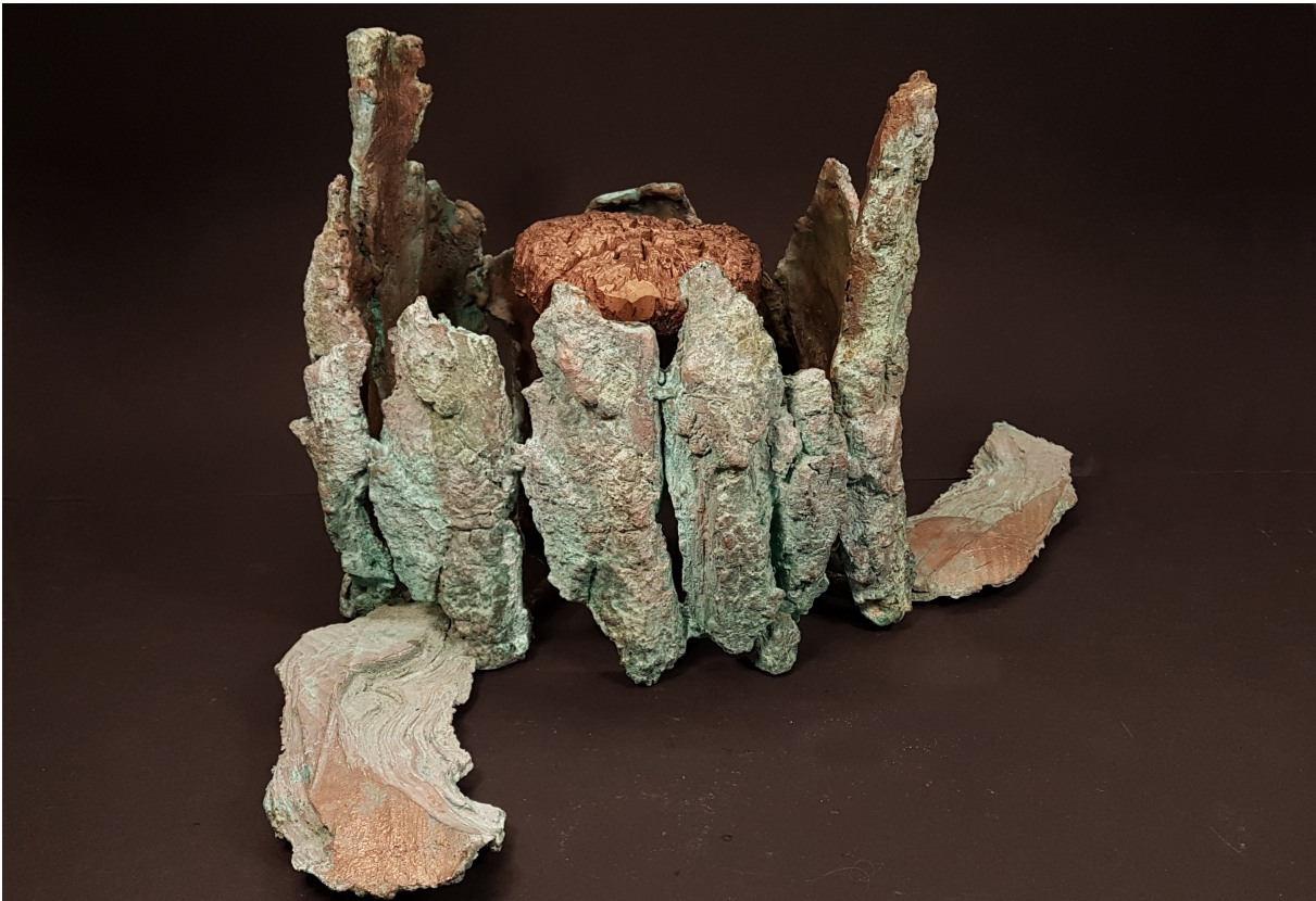
Boskroon / Forrest Crown

Van mijn hand staat er 'Boskroon'. Een wat groter bronzen sculptuur dat perfect past bij het herfstige weer.