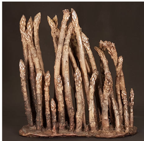
Donker bos / Dark Forrest