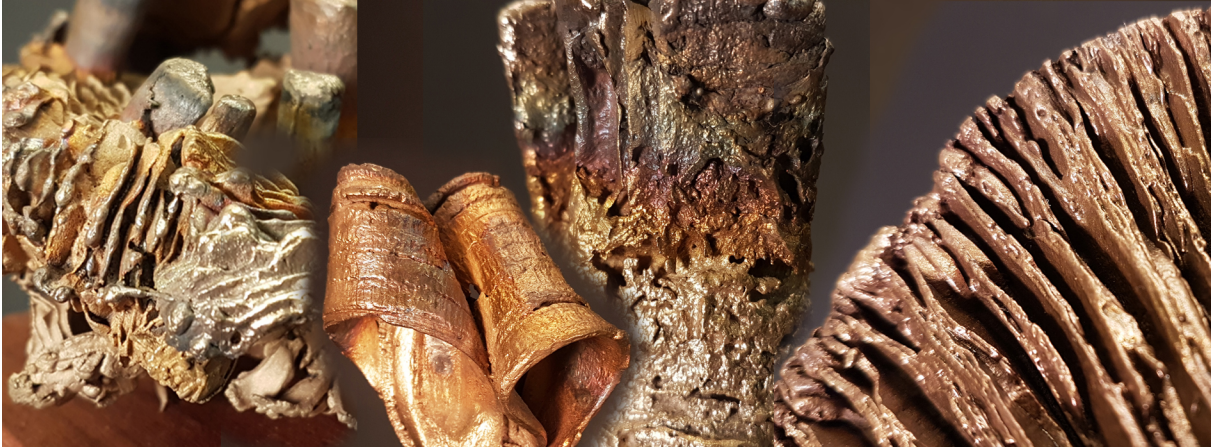
Preview nieuwe werken september 2021 (detail)

Kom de werken 'live' bekijken in De Werkplek, Slijperweg 12A (2 en 3 oktober, 12:00 – 18:00 uur)