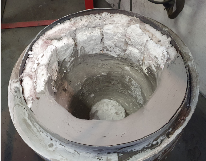
Restauratie van de oven-wand

Het meeste te lijden heeft de wand van de oven. De binnenwand bestaat uit 10 cm dik vuurvaste isolatedeken bekleed met hittebestendig mortel. De binnenwand wordt bij het stoken letterlijk roodgloeiend. Na elke 10 keer gieten, vervang ik de hele binnenwand.