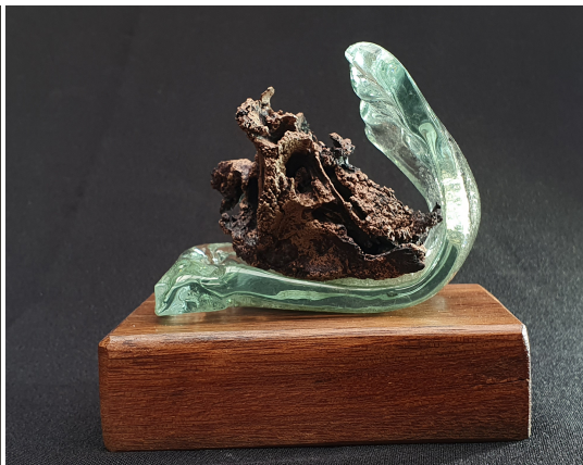
Blue Donut en Breaking Wave