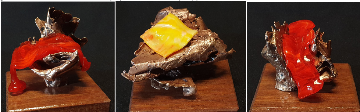
'Dripping red', 'Cheeseburger' en 'Rood glas op brons' voor in de Art Shop (elk circa 10 x 10 cm)

Als extraatje richten de kunstenaars een Art Shop in waar ansichtkaarten, kunstboeken en kleiner werk (met een maximum prijs van € 150) te koop zijn. Speciaal voor de Art Shop heb ik nieuwe bronzen sleutelhangers gemaakt, alsmede wat van de populaire bronzen proppen.